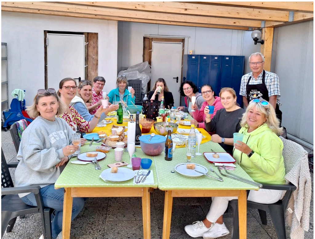
Hier ein Beispiel für viele: der Grillabend der Stepper

Die Voraussetzungen für solche Treffen sind an unserer Turnhalle wirklich gut, da wir wetterunabhängige Räumlichkeiten haben.