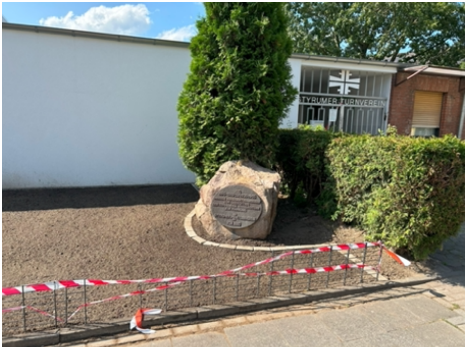
Der bisherige Eingang mit dem Gedenkstein ist unverändert geblieben